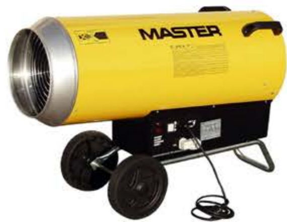
CALEFACTOR DE GAS "MASTER BLP"