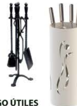
JUEGO ÚTILES CHIMENEA