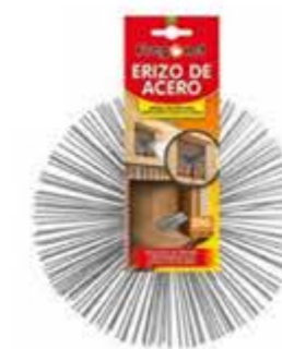
DESHOLLINADOR ERIZO / Varillas de Acero.