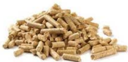
SACOS PELLET 15KG.