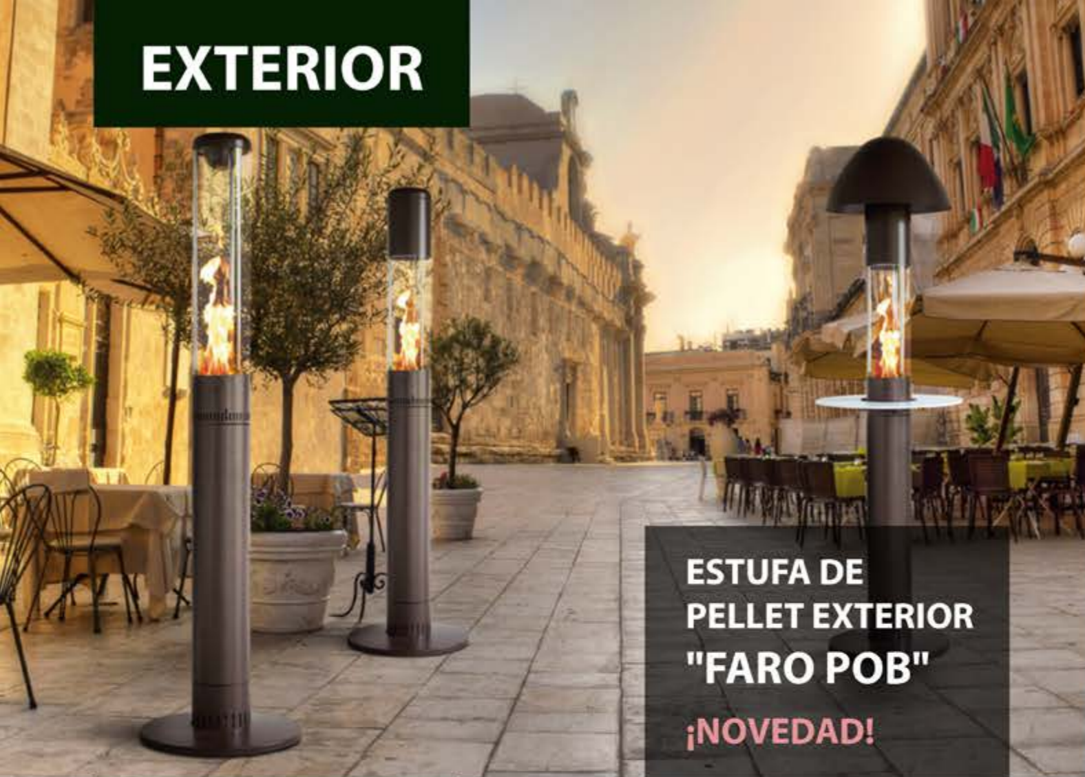
ESTUFA DE PELLETT EXTERIOR "FARO POB" ¡NOVEDAD!